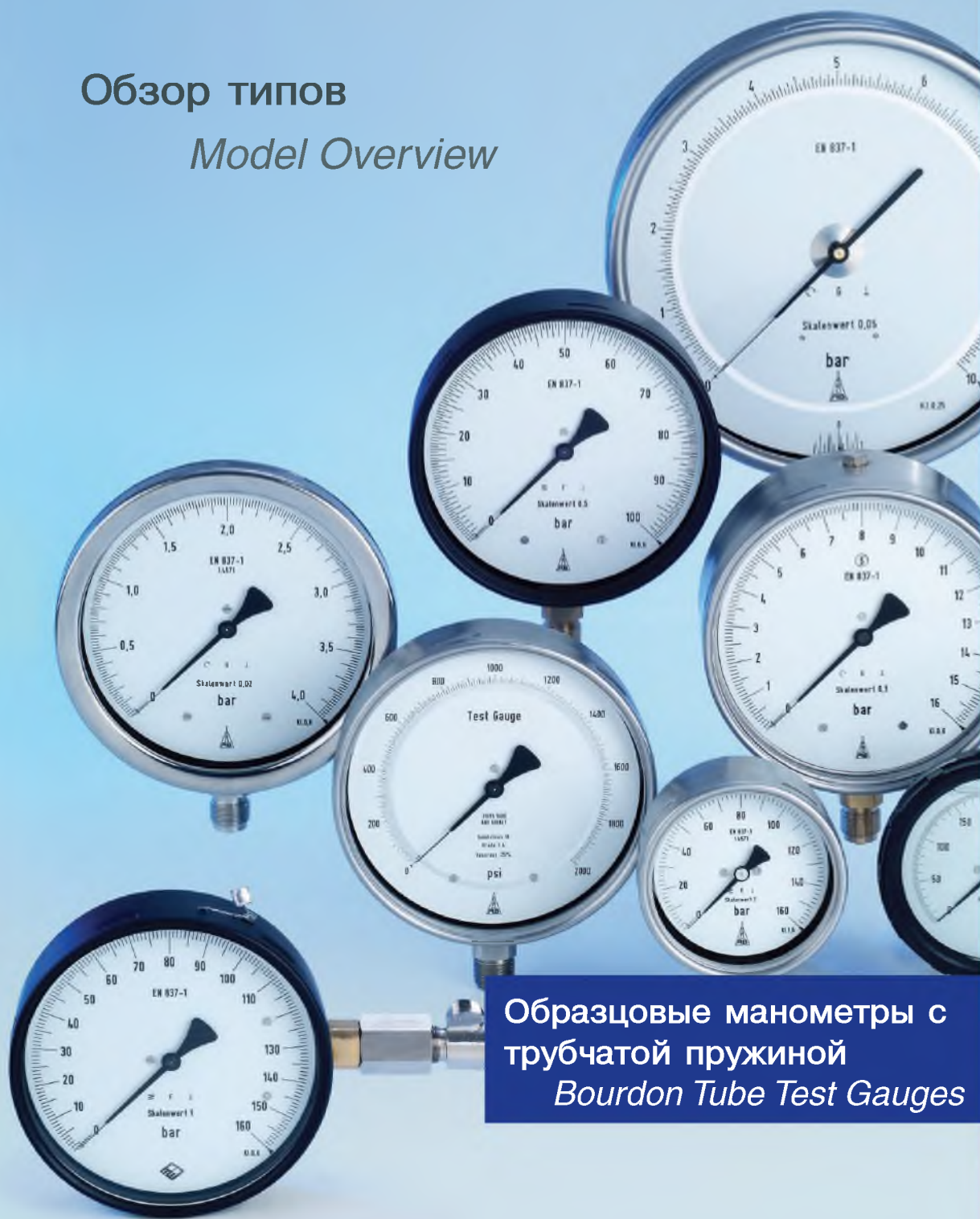
Образцовые манометры с трубчатой пружиной Bourdon Tube Test Gauges

Архангельск (8182)63-90-72 Астана (7172)727-132 Астрахань (8512)99-46-04 Барнаул (3852)73-04-60 Белгород (4722)40-23-64 Брянск (4832)59-03-52 Владивосток (423)249-28-31 Волгоград (844)278-03-48 Вологда (8172)26-41-59 Воронеж (473)204-51-73 Екатеринбург (343)384-55-89