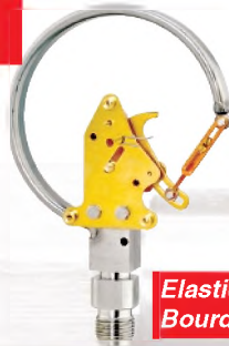
Elastic element, Bourdon tube type, C-form

Измерительная система образцового манометра - трубчатая пружина простая